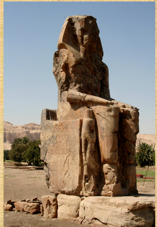
Colosse de MEMNON : AMENOPHIS III

Mercredi 29 septembre, 6,13 et 20 octobre, 10 novembre 2010