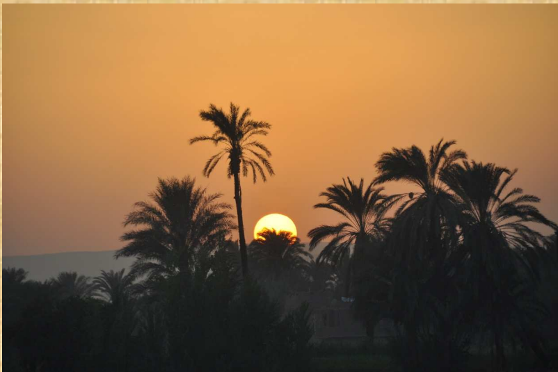
Coucher de soleil au bord Nil

Pour de plus amples explications, vous pouvez appeler Marie-Françoise LEBEAU Tel : 03 25 38 77 66 ou 06 07 21 80 07