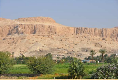
Les zones sombres au-dessus de la verdure correspondent aux maisons démolies de la Vallée des Nobles.